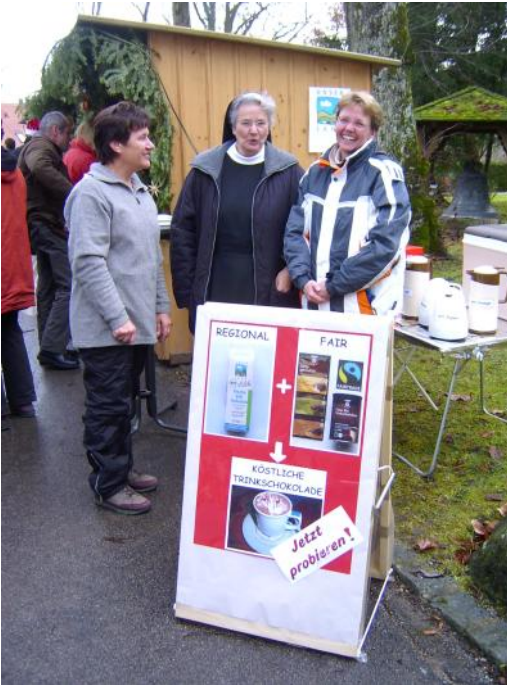
Auf dem Weihnachtsmarkt 2010

Welt-Verkauf“. An ihrer Seite waren stets viele tatkräftige Helferinnen und Helfer! Auch ihnen allen ein herzliches Dankeschön!